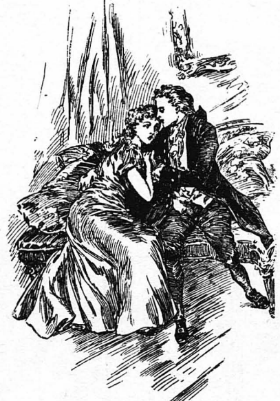
Ὁ μαρκήσιος τὴν ἐλάτρευε, δὲν τὴν ἄφνε καθόλου σχεδὸν ἀπ' τὴν ἀγκαλιά του...

Γαλάζιες φλόγες ὑπόσθηκαν τότε μὲ μᾶς ἀπὸ τὸ πάτωμα καὶ περιέκλωσαν τὴν μαρκήσια. Κι' ἀμέσως, μέσα σὲ μιά στιγμή, καὶ ἡ