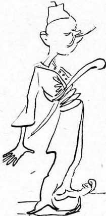
'Ο Τουκαλιανός καθάσσης νόμιζε πως νειρεύεται!...

"Όπως έγραφα και στο προηγούμενο φύλλο, ο Γκίνης στο σπίτι του οποίου συγκεντρωθήκατε στάς Σέρρας και περνούσαμε ενόχληση τις ώρες μας, ήταν αγαθός άνθρωπος και κάλλιστος φίλος. Συχνά τα βράδια μάζ διηγείτο διάφορες περιπέτειές του, με τον βασιλέα Κωνσταντίνο, ο οποίος δούλας πήγαινε στάς Σέρρας, έμενε στο σπίτι του. Διατηρούσε μάλιστα ο Γκίνης απειραχτή τη κάμαρη στην οποία κοιμότανε ο Βασιλιάς, με τις ιδιαίτερες κολώνιες και τα σαπούνια, που μεταχειριζότανε ο Κωνσταντίνος.