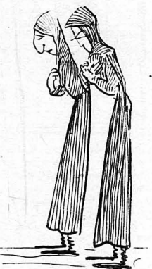
"Όλες ήσαν χήρες!...

— Ναι, δέν σου λέω, μά νόμισα ότι θά... μάγαμε μωσά! ΣΤΟ ΠΡΟΣ ΕΚΕΣ: Τό τέλος.