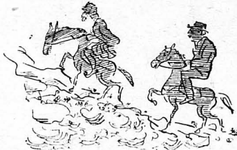
Σάν παλαβοι γριζόουμε τις νύχτες...