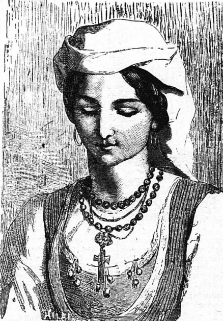
Νεαρὰ Γιαννιώτισσα ἐπὶ τουρκοκρατίας.