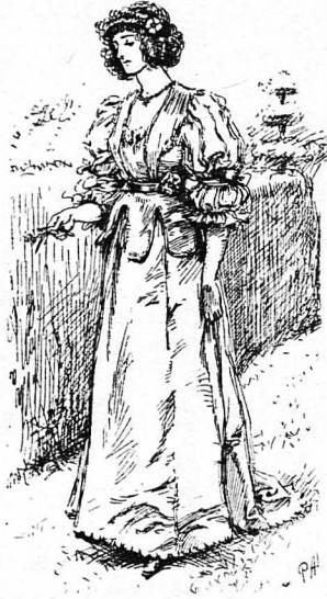
Η μεγαλειότερη της ευχαρίστηση ήταν να βρισκόταν στην έξοχή...

Ο ύφρανός είχε τώρα σκοτεινίσει κι' ή άπέραντη θάλασσα