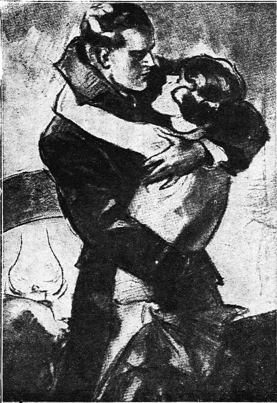
Τὴν ἀγκάλιασα καὶ δάγκωσα ἀχόρταγα, ἄγρια τὰ χεῖλη τῆς...