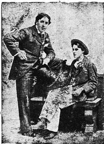
Ο Οσκάρ Ουάιλντ και ό φίλοσ του λόγδοσ Άλφρέδοσ Ντούγκλασ.