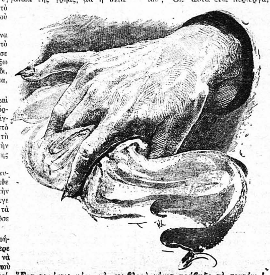
"Ἐνα τεράστιο χέρι, μὲ σουβλερὰ νύχια τραβῆξε τὸ σεντόνι !...