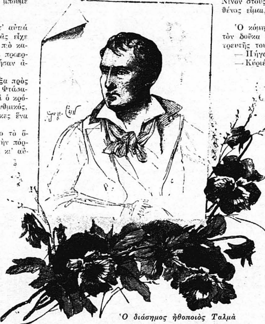
Ο διάσημος ήθοποιός Ταλιμά