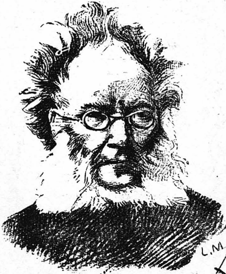
Ο Έρρίκος Ίψεν

ΣΤΟ ΠΡΟΣΕΧΕΣ: Τό Γ' και τελευταίο μέρος της βιογραφίας του Ίψεν.