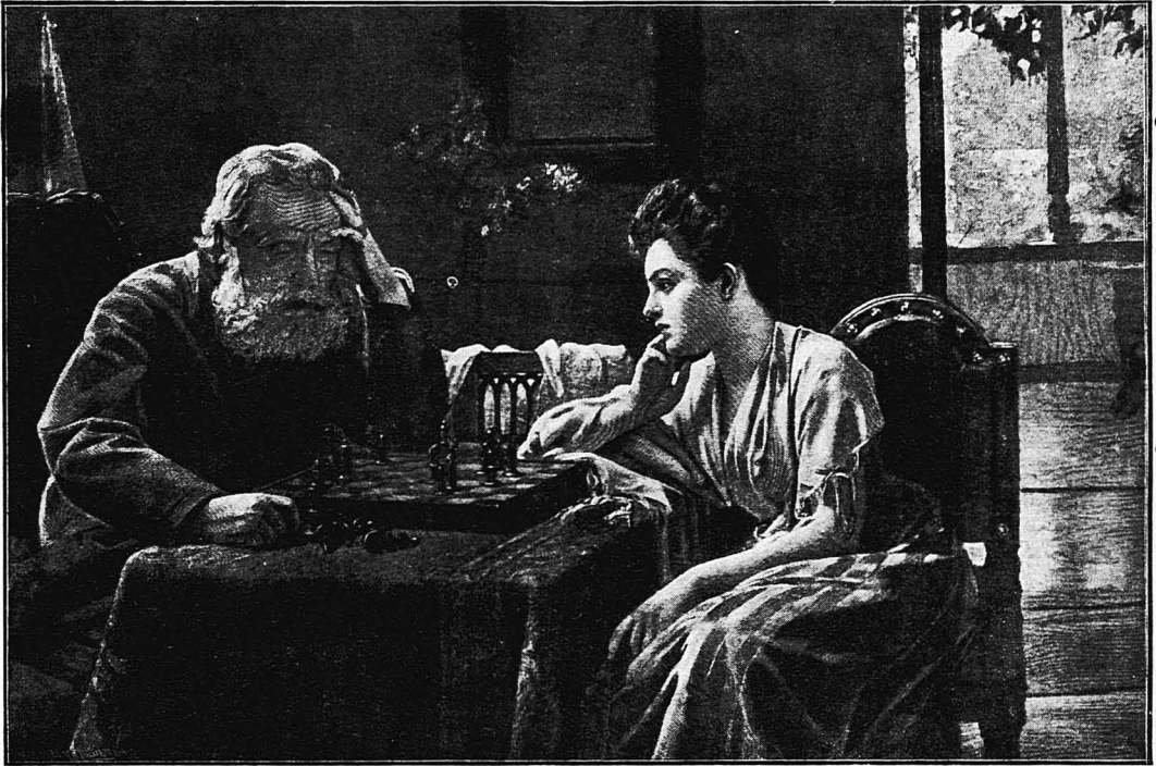
ΜΙΑ ΠΑΡΤΙΔΑ ΣΚΑΚΙ

(Πινάξ του Γερμανού ζωγράφου Φράτς Χάουφτιγκλ)