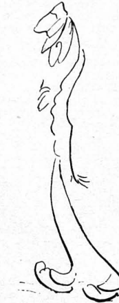
Δυό και δέκα... δώδεκα...

—Τί λέτε, κύριε έπιλοχία, είτε μειδιών ό Ντιντής.