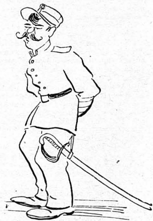
—Τί διάβολο! Για δεσποινίδα μέ πέρασεξ;...