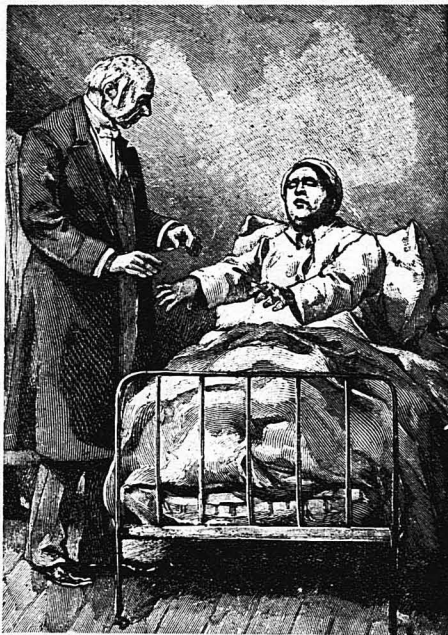
ΓΡΗΑ ΜΑΡΙΑ.— Πού εινε το παιδί μου, πού εινε ...

άλλοιμονο!... Ό γιός της δέ θάρθη. Δέν μπορεί νάρθη. Είνε μηχανικός σ' ένα πλοίο που δέν θά φτάση στη Χάβηνα παρά μετά τρείς μέρες. Κι' έτσι ή φτωχή μάνα δέν θά ξαναϊδή ποτέ το γιό της.