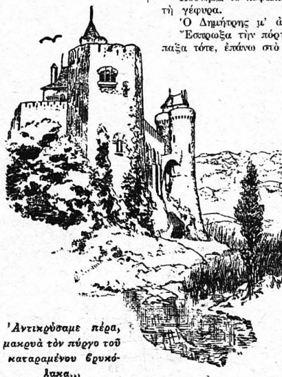
Άντικρούσαμε πέρα, μακρού τόν πύργο τού καταραμένου βρυκόλακα...

— Άχρσια ν' άνηρωκώ. Δέν έπρεπε νά κούνημε τόν καιρό μας. Έπρεπε νά σπύσωμε έν άνίχη την πύλη, νά την κούρωμε. Τό κούμμο ήταν τή προτιμότερο. Θά σφωράκαμε μπρός της ξερωλάδα, θά τούς