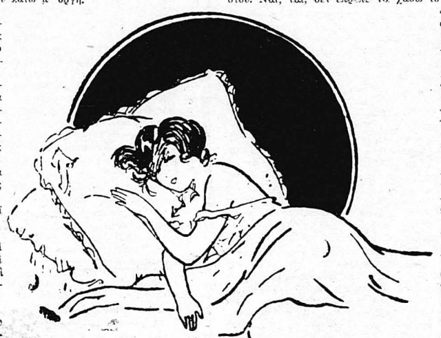
Ή Άρλέττα κοιμόταν ήσυχη.

Κάθονουα πάνω στη στέγη και κλαίνε, κλαίνε όλονυχτίς... Μά τώρα πιά χρειάζεται καρδιά. Όλα είναι έτοιμα. Τ' άλωγα κρεταρονό στο στανόλο. Μύλησα με τή γιαγιά, Ξηγηθήρα με τή παιδιά μου. Μόλις γλυκοχαράζει ή αλλη φεύγομε με τή Δημήτρη. Θά πάμε νά πολυηθώσουμε τή βρυκόλακα μέσα στό κάστρο τού. Ή σημερινή μέρα θάναυ ή