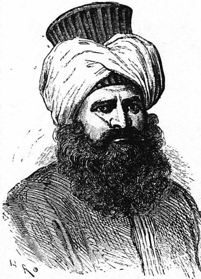
Ο Μπέης του Άλγερίου.

Ο Γιουσέφ δεν ήταν ό μόνος Ρέις που κατήγετο από Έλληνες. Κι' ένας άλλος άκόμη ήγεμών του Άλγερίου ήταν Άλγερινός καταγωγής, ό Μάμυ Μοχαμέτ, που βασίλευσε ένα μόνο χρόνο, (1584—1585). Αυτός ήταν γιος ενός Άλβανού και μάς Χριστιανής Έλληνίδος από την Ήπειρο. Η μητέρα όμως, όταν μεγάλωσε, γίνεται Μουσουλιμάνος. Γι' αυτό δε και του έδωκαν το άραβικό παρατσούκλι «Έλ—Βουλιτσά», το όποιο σημαίνει «άδρησθήσομος». Κατά περιεργή σύμπτωση, ό Έλληνας αυτός άδρησθήσομος Μάμυ Μοχαμέτ ήταν ό ίδιος που, επί κεφαλής του άλγερινού στόλου, έλαβε μέρος στην περιφημη ναυμαχία της Ναυπάκτου το 1571, όπου όλοι οι Χριστιανικοί στόλοι ενώθηκαν να πολεμήσουν τον πανίσχυρο Τούρκο στόλο και τον στήριξαν. Ο Μάμυ Μοχαμέτ εν τούτοις, όχι μόνον κατόρθωσε να ξεφύγη από την παναλήθρια, αλλά και αχμαλώτισσε άργότερα ένα Ίσπανικό καρβάνι που πολεμούσε μαζύ με το Χριστιανικό στόλο. Και στο καρβάνι αυτό ήταν καπετάνιος ό μέγας συγγραφέας του άθανάτου ελόν Κιχάντρ, ό Μιχαήλ Θεοβάντες, ό όποιος σφύρησε στην Άλγερία σκλάβος του για πολλά χρόνια και ύπέφερε φορικά βασανιστήρια.