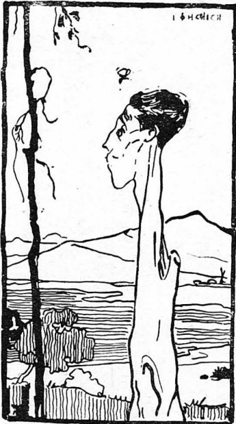
Ό ζωγράφος κ. Γερασιώτης, (Γελοιογραφία τού κ. Ροιλού, από τό Λεύκωμα τού κ. Άλ. Φιλαδέλφεως).