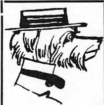
Σκίτσο του έν Παρισίους μεγάλου Έλληνος ζωγράφου κ. Γαλάνη. (Από τό Λεύκωμα τού κ. Άλ. Φιλαδέλφεως).

ΤΑ ΛΕΥΚΩΜΑΤΑ ΤΗΣ ΔΕΙΜΝΗΣΤΟΥ ΔΕΣΠΟΙΝΗΣ ΒΗΤΑΣ ΚΑΙ ΤΟΥ Κ. ΑΛΕΞΑΝΔΡΟΥ ΦΙΛΑΔΕΛΦΕΩΣ