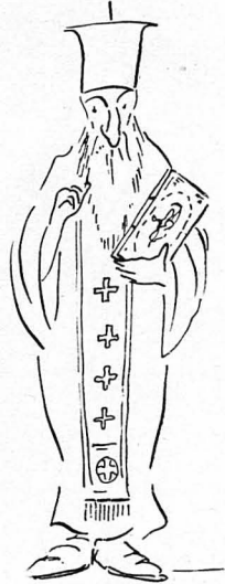
— ‘Ιερέας, άλτ!

— Και Ξπειτα λένε ότι δέν Ξεδιαλύνουνη ή πλάτες, ελτεν ό φτωχός έπιλοχίας, άντι άλλου παρανόμου, για την τύχη του και για την τιμωρία, που του Ξπεσε σ τ ή ν π λ ά τ η τη δική του!... ΣΤΑΜ. ΣΤΑΜ.