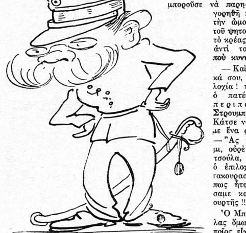
‘Ο έπιθεωρητής του άποσπάματος λοχαγός.