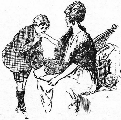
Φιλεί με σεβασμό τὸ χέρι τῆς και κάθεται πλάι τῆς...

Τρεῖς χρόνια περνᾶν ἔτσι, τρεῖς χρόνια ἔξᾶστερα και φωτόλουσα, ἄν και συχνὰ διακόπτονται ἀπὸ βροντῆς και καταιγίδες.