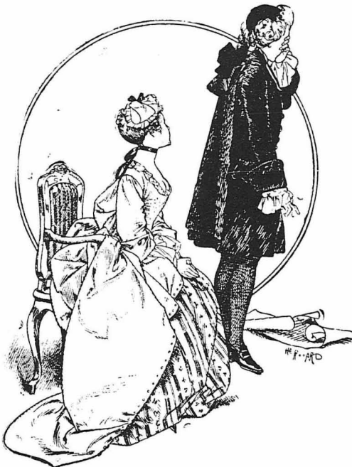
Ο Γουαδανί έωυγε γεμάτος άπελυσία...

Μιά φορά ή Φαουστίνα έπρόκειτο να φροδηή κατά την προσεγή