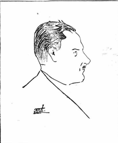
Ὁ κ. Φοῖξος Ἀριστεῦς. (Σκίτσο τοῦ κ. Λευκαδίτη)