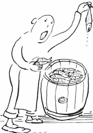
Σ' ένα μακαλικό βιτηρέτις...

"Όλα τα είχαν. Τιποτε δεν τους έλειπε! Χρήματα, μεγάλα, αυτοκίνητα, αγέσεις με έπισημους, τηλεγρα-