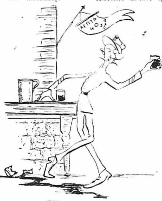
"Ο καυμένος ό θείος πού έλεσαν είνε τού Σεντάν.

Κατόπι αυτών, η οικογένεια αποχώσισε να στραφή και να άν- τίση προγόνους μόνον απ' τού οικογενειακό τους παρελθόν. Και τότε ό Μπακαλιάρηολο βιτηρέτις πού είχε κάποιον θείο κ' αυτός, ση- μαινόνα μια φορά κ' έναν καρφό. Τρέχει λοι- πόν και βράζει από μια καστίλα, παληά κ' άπορημένη στο ύψιστο, κάποια καλύτερ εί- κόνα σκουμυμένη. —Τι είν' αυτό; τόν ρώτησε η γυναίκα του. —Δεν βλέπεις... "Η είκόνα τού θείου, τού "Ανασταάση, πού άπορήναε λοζιάς μ'ά φορά κ' έδρασε στ' "Αγραφα κ' ως άπο- σπασματάχρης... "Υλαξιοματικός άπόστρα- τος... —Με τα σωστά σου θέλεις να κομιάξες έναν λοζία μέσα στο σαλόνι... Νά ήταν... λοχαγός, τούλάχιτον... Τι έντύπωσι θα κίνη ένας λοζιάς, έτσι καθώς είναι, με τέτοια μο- στίνα... —"Αμα τού περάσω ένα βρονία, θα γίνη πού φανταχτερός. —"Όσα βρονία κ' αν τού βάλεις, αυτός λοζιάς θα είνε και θα μείνει πάντοτε!... —Και δεν τών δίνομις σ' ένα λοχαγός να τόν κίνη λοχαγό, είτε κ' η δεσποινίδα