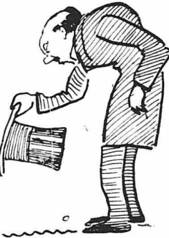
"Όλοι οι έπισημοι υπεκλίνοντο μπροστά τους.