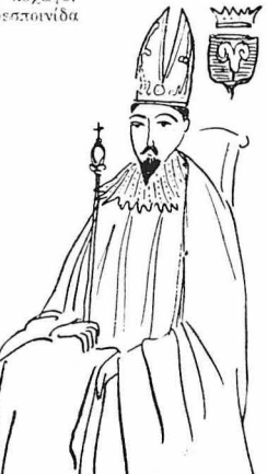
"Αγόρσας μερικόνος προγόνους σου, από την... αγορά!...

"Αδελέττα, πού, καθώς είπαμε πολλές φορές ό μπαταξής της την έλεγε "Ουδέττας, κατά λάθος πάντοτε!... "Έτσι, ένας λοχαγός βοι- κός, κατορθώσε να κίνη σε δυό μέρες δυιτ δεν θα υπορόσσε να κατορθώση σε δεκατέντε χρόνια ένας καθώς πρέπει ύπουργός τών Στρατιωτικών... Κι' η είκόνα πού έφάνταζε στο άριστοκρατικό σαλόνι, με μια πρώτη τάξιος σπολή από... χα- κί, με ομοκωνογραφο ηλιόμο και μ' ένα—δυό παράσημα από στη- θος. —Είνε ό θείος μας, έλεγε στις φιλενάδες της η δεσποινίς "Αδελέττα. "Έλεσε στα 1870 στο Σεντάν. —Τι ήθελε στη Γαλλία; σω- τοίσαν θανατώσουσι η φίλες της. —Είχε κατατάχθει έθελοντής σ' Αγόρσας μερικόνος προγόνους σ' το Γαλλικό στρατό. Γι' αυτό