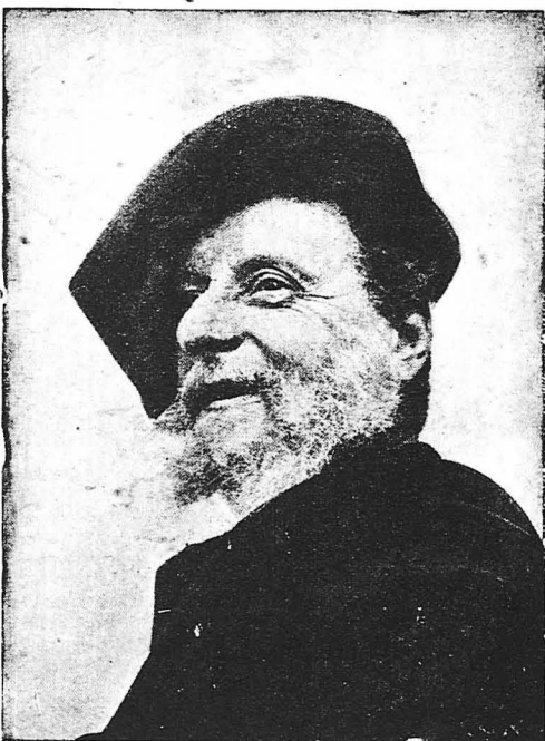
Ο Ιταλός ποιητής Στεκκίετι.