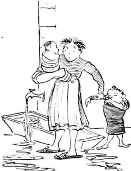
Τό άφησε ή μάνα του όρφανό και παιδεμένο!