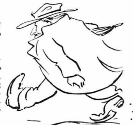
—Δέν τήν θέλω, είπα... Φεύ γω... Δέν τήν παρίνω... Δέν τό λέω τό «ναι»!...

Αυτίεψε σαν τό σναί, καπίσε σαν τό καματερό τό βόδι, ν' άποτήρη μια περιουσία κι' αυτός, να ίδη άνάπαρη στα γηρατιά του. Παντρέφτηκε κι' άποτήρη παιδιά, ξεόδεγε για δάιτα, έφρεξε, σκοτόθηρε για να τά γλυτόση άτ' τό στρατό, να κάνη ότι του ήθετοσαν. να μίη τους λείρη τίποτε!... Κι' όταν πια γέφασε και κατάλαβε πως ή δουλειά γίνονταν βαρειά, πουλό βαρειά κι' αυτόν, παράδωσε τό μαζάκι στα παιδιά του, για να καθήρη κι' αυτός να ξεκουραστή. Κι' ήτανε τόρα κάθε μέρα και τάβλεπε και χαρούνε τόν κόπον του και τόν βασάνον μαζό ή-λόκληρη ζωή, τόν καρπό. Και όσν πατέρας που ή-ταν και νοικοζύρη και της περιουσίας ό δημισυρόζ, καθότανε εκεί κοντά στον υπεζαχτά κι' άνοιγε να πέτνον τά νομιστάκια και να ή-χορν, σαν θεία μοσική για δάπτον. Άνοιγε να γεμίρη χρήματα ό «μπεζαχτάς» και γεμίσε συγγωνός ή φρηή του ικανοποίησι και αγα-λίσιος μεγάλη. Κι' έβουε τά χέρια του και χάιδε τήν εισπραξι, σαν να χάιδε όλη τήν κομισατική και πολυβασιανμένη τή ζωή του, τή ζωή του πέφασε, που ύπόφερε κι' άπόλασε, για να καταλήρη στο εύτυχισμένο αυτό τέλος! Κι' εκεί που ξαναζόσε κι' άποτάμιασε τους κόπον και τά καζάντια του, πλησιάζει έξαφνα τό παιδί του και τό λέει: