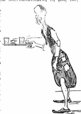
—Παράπονο, λέει, έχω; είπε ό γέρο καφεζής.

Ό Γιωργαζής ξεροκατάπινε, αζούγοντας όλη αυτή τήν ιστορία. Τήν είχε άβδη. Τί του ήθε να τόν καλύτερη, τό γηροκοσείο, να τού προσφέρη καφέ; Τή στιγμή αυτή, ό καφεζής, κρηό Μανουλάκης, που στέκοτανε με τό δίσκο φορτωμένο με ποτήρια και