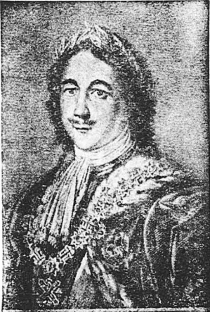
‘Ο Μέγας Πέτρος

‘Αφού καταστατάλησε τό δημόσιο θησαυρό, άρχισε να βασιανίξη και να φορολογη άγιότως τό δυστυχισμένο Ρωσικό λαό, για να ποριστή κανονικά χρήματα. ‘Ερχόδωσε επίσης, χάριν των χρημάτων, τά συμφέροντα του Τσάρου και της Ρωσίας. ‘Ετσι άπέκτησε άναριθμήτους έχθρούς, οι όποιοι Ξηπόσαν τήν κατάλληλη ευκαιρία για να τόν Ξεγονόσουν. Και επειδή ο Μέγας Πέτρος, μολοντί όταν έπέστρεψε άλ’ τό ταξείδι του, δέν τόν έτιμώρησε,