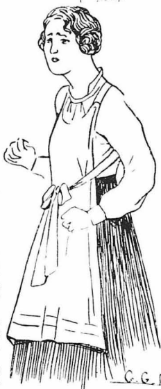
—Αχ, κόριε!... Πέθανε γιά σάς!... Μου ελτε ή ύπηρετρια.