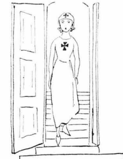
Κατέβηκε μία άφρατη νοσοκόμα.

Το πολέμου τ' άφρανενα χίματα μάζ είχαν πνίξει ένα πρωί στη Βεργόια. Είμαστε τρεις. Ο ύποφανόντος, ο Μήτσος ο Πλαστήρας, ο ανταρματούχος σήμερα της στρατιωτικής Λαοκρασίας κι' ο Σπυρίδης, καθηγητής κατόπι στην Καλλιθέα, άν είναι άζωια έχει.