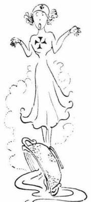
"Η νοσοκόμα έμεινε με άνοιχτό το στόμα.

— "Ε, λοιπόν σας έξω μού σούπα σήμερα κι' έξη κότες και κομμάτια από άφρά!... Από δάχτυλα ανόζομα?