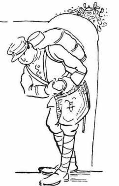
"Έβάλαμε με προσοχή τις ρέδες στα σακκιδιά μάζ.