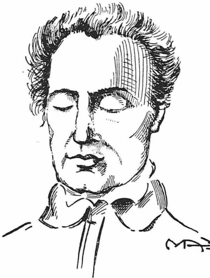
Ο Διονύσιος Σολωμός νεκρός