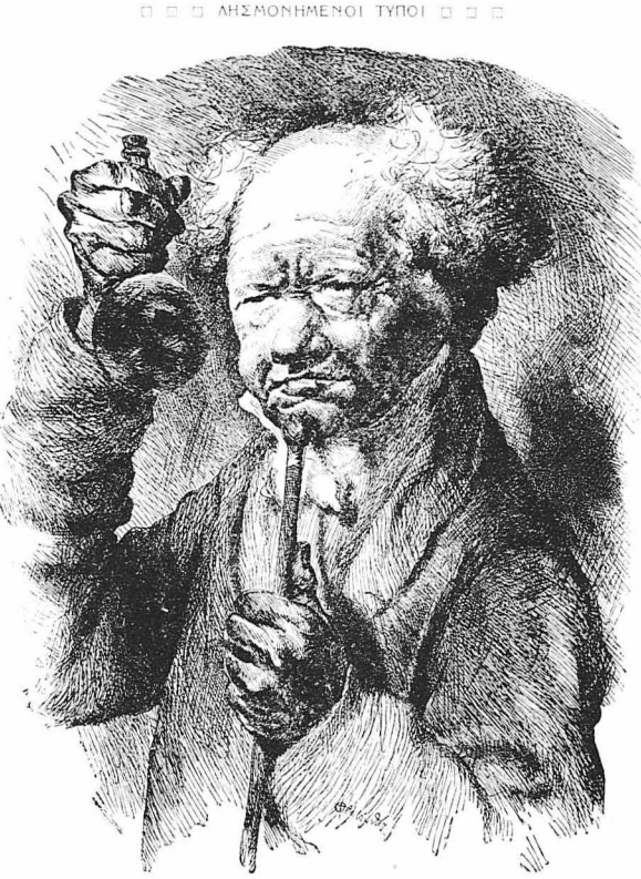
Ό Γιατρός τοϋ παληού καλού χωροδ

Ήτοι σέ κάθε άνοιγμα πού γινόταν βρισκόταν κι' άπό ένας νέος φακέλλος και τό παιγνίδι αυτό ενανέληθη Ήξη φορές άκόμα. Επί τέλος στό 1890 άπεκαλιώθη ή πραγματική διαθήκη και οι άτιμίες κληρονομίες πού περιέχονταν τούτον καιρό, λίγο έλειψε να λάθουν κολύτο διαβαζόοντας την. Ίδου πού ήταν τό περιεχόμενο της: "Εγκαταλείπω στους κληρονομούς μου όλόκληρη την περιουσία μου με τόν όρον ότι θα μοιραστούν μετά είκοσι χρόνια, όηλαδή στό 1910. Τα εισοδήματα έν τώ μεταξύ θα περιέρχονταν στους κληρονομούς μου, άρκει να τηρήσουν τις παρακάτω επιθυμίες μου: "Ό αδελφός μου Π, θα σέρη διαρκώς καθ' όλη αυτή την εικοσαετία τό ακληρό του καπέλλο πού ήταν τό προσφιλέ κάλυμμα του επί δέκα χρόνια. "Ό άνεμιός μου Μ, τις Κυριακές και τις άλλες επίσημες γιορτές θα φορή έκείνη τη μπλε ρεδίγκοτα μου πού μ' εύνισσε τόσο πού προ έλατίας στον πρώτο έρωτά μου. "Ό αδελφός μου Κ, άπό σπασμό πρός τις συνηθειές μου, θ' όσφή τα γένεα του και δέν θα κοθή τα μαλλιά του παρα κάθε όχτώ μήνες. "Εν περιπτώσι άπέσισης τών άνωτέρω όρον, οι κληρονομοί μου γάουνο κάθε δικαίωμα και ή περιουσία μου μαζί με τό εισοδήματό της περιέρχεται στο γιατρό μου και στο δικηγόρο μου, τους όποιους διορίζω επιτηρητάς και εκτελεστάς της διαθήκης μου."