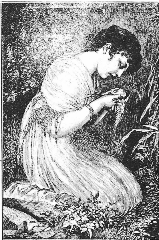
Ο Θάνατος του Πουλιού

Κατόπι του θανάτου του Πτολεμαίου, η Κλεοπάτρα, εύχαριστημένη που έμενε μόνη της, άνεκήριξε συμβασιλέα το γνήσιο της