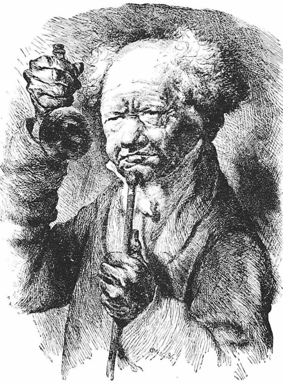
Ό Γιάτρος του παληού καλού καιρού

Κάποιος άλλος Παρισινός, ιδιοκτήτης έστιατεριού, πεθάνοντας, κληροδότησε την περιουσία του στις δύο άνεμίες του, με μιά διαθήκη, στην όποια μεταξόν των άλλων έγράφοντο και τά έξησι: "Επειδή θέλω να σερνώ χρισμός στους συμπολίτες μου, παραγγέλλω να στήθ στον τάφο μου μιά στήλη κι' έπίστω σ' αυτήν μιά μεταλλήνη πινακία: