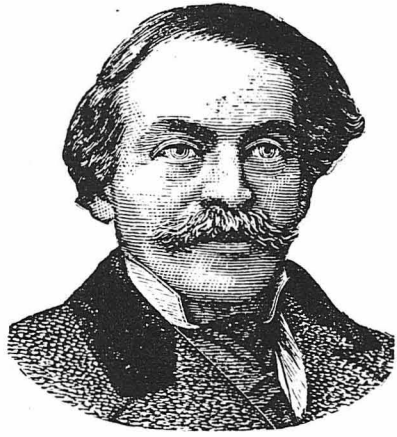
Ο Στέφανος Ξένος

'Ετσι το ζήτημα πήρε κομικό χρώμα και έδόσε άφθονη βλη στα σατιρικά φύλλα της έποχής. Πρώ πάντων ενέντευσε τον Σουρή. Την έποχη εκείνη ο Σουής ήταν νεαρός φοιτητής της Φιλοσοφίας, έγραφε όμως στα διάφορα σατιρικά φύλλα και πρό πάντων στο «Μή Κάμεσσα» του Γαβρηλίδη. Τότε ο Γαβρηλίδης συνήθιζε να κλειδώνει τον ποιητή σ' ένα δομάτιο που δεν τον έλευθόνη, παρά όταν του παρόντε τελειωμένο το ποιήμα του. Κλεισμένος λοιπόν ο Σουής, έσπασινε την περίφημη άλληλογραφία Ξένου—Κομμουνόπουλου σε διάφορα ποιήματα. 'Εν' από τα νοσητώτερα είναι κι' εκείνο που περιγράφει τί είδε ο Στέφ. Ξένος στο χαρέμι του Σουλτάνου: