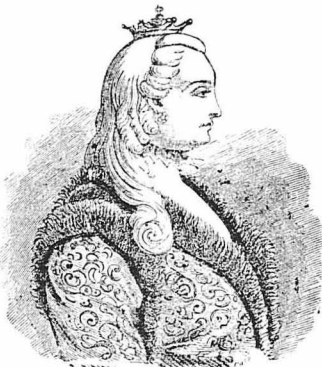
Η Αυτοκράτειρα Αικατερίνη ή Β'.

Ο Μακάρωφ κρηματίστηκε κ' έγώρησε στη Ρωσία, όπου παρέδόσε τα λείψανα της έπίσης σημαίας στην Αυτοκράτειρα Αικατερίνη. Η Αικατερίνη τα κατέθεσε στο Ιστοικό Μουσείο της Πετρούπολεως, όπου εβόηοντο μέχρι της άναρχώσεως της χώρας εις Σοβιετιισμόν.