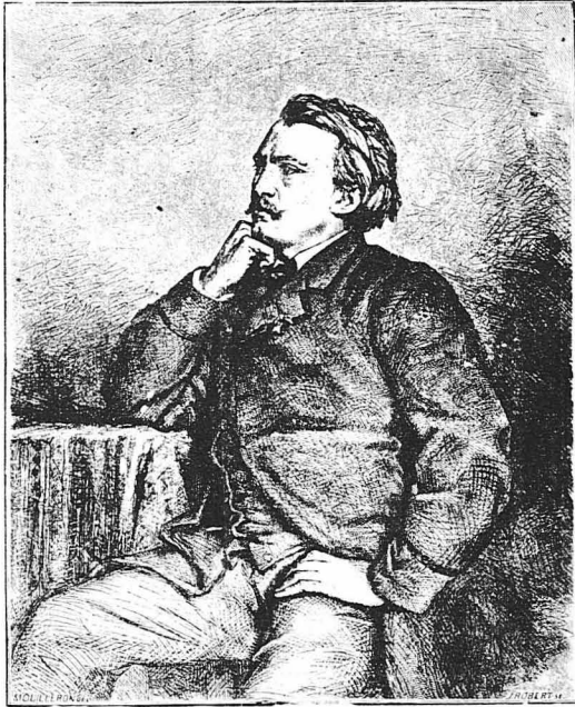
Ο Γάλλος ζωγράφος Γουσταύος Ντορέ