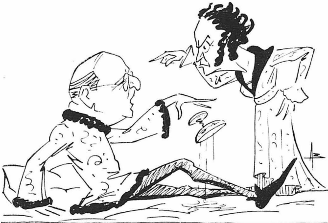
Ὁ κ. Θ. Συναϊνίδος καὶ ἡ Λουκρητία Βοργία. Ὁ κ. Συναϊνίδος ἐπιτε πλῆον τὸ δηλητηριώδη. Ἄς ὄρωται οἱ κριτικοί!... (Σκίτσο τοῦ κ. Βώττη)