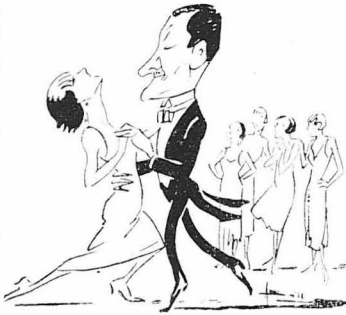
Ὁ κ. Δαγαλιῆς ἐν μέσῳ τῶν συγχρόνων γυναικῶν. Χοροῦνται... ἀλλὰ ὄχι τὸν χορὸν τοῦ Ἡσαΐα... (Σκίτσο τοῦ κ. Βώττη)

Φωκιστῶν!... ΣΤΟ ΠΡΟΣΕΧΕΣ: Ἄλ- λες ἀπάντησεις.