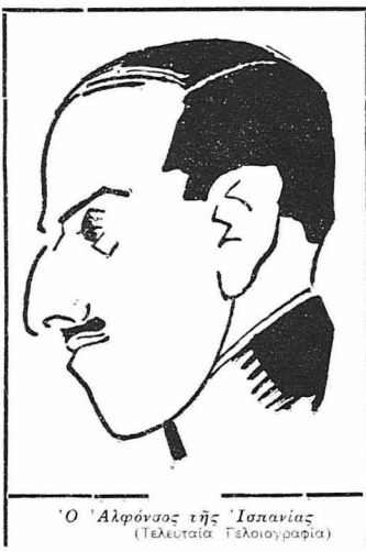
'Ο 'Αλφόνσος της 'Ισπανίας (Τελευταία 'Επιτομιογραφία)