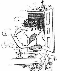
—Σαμαράδῃ! Μὲ τρία μὰ τσα ἄνιθο!...