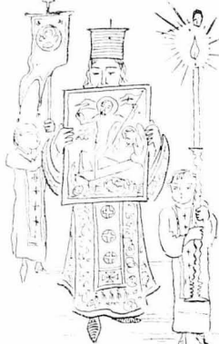
Ἡ Ἀνάστασις ἐξήρχη ἐν δόξῃ καὶ πομπῇ.