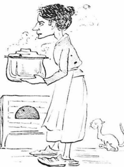
Καλὴ καὶ δουλεντάρα...