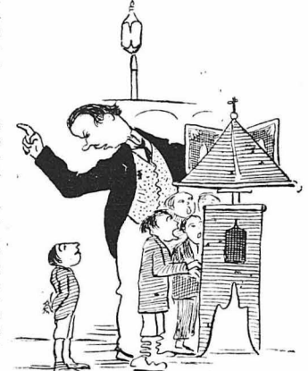
—Πῆγνανε γρηγορα νὰ πῆς τῆς Σαμαράδῃς...