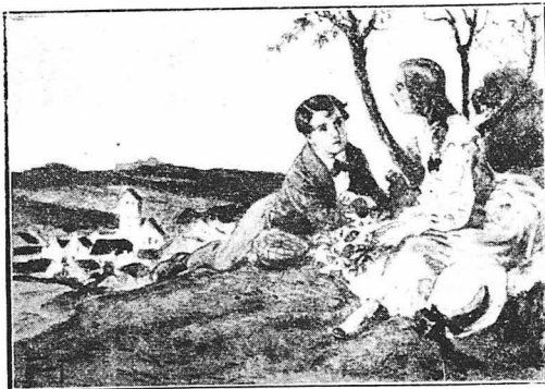
...Τήν έβλεπα με τή χείρα στυρωμένη σαν σε δέηση...

Τά λόγια αυτά της Σοφάνας με πλήγωσαν κατάκαρδα. Μαζύ με την