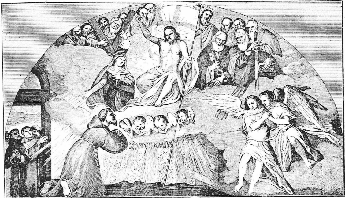
Ο ΘΡΙΑΜΒΟΣ ΤΟΥ ΚΥΡΙΟΥ (Πίναξ του ζωγράφου Ι. Λιγκότα)