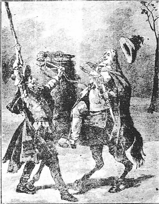
Κάποιος καταλόγιος που θέλησε να τον συγκαταστήσει, κούνησε χέρι με μιά σταθά!...