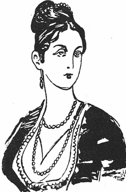
'Η Δούμισσα τῆς Πλακεντίας