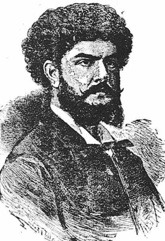
'Ο συγγραφέας τοϋ διηγήματος Ζαν Ρισπέν