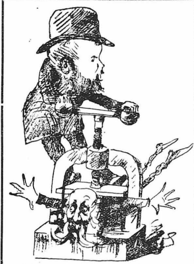
Ο Ρώμπολδ... πιέζων τον Δηληγιάννη!... (Γελοιογραφία του Θ. Ανίνου στο «Άστυ» του 1886)

Παρακάτω ο Φασουλήσ θυμίζει στον Άγγιλο πρεσβευτή το επεισόδιο που έλεγε συμβεί στο Λυκαβητό πρό τριετίας, μεταθύ τοσ τότε πρεσβευτού της Άγγλιας Νικόλασον και του δασοφύλακος Καλποφύου, επί πρω-