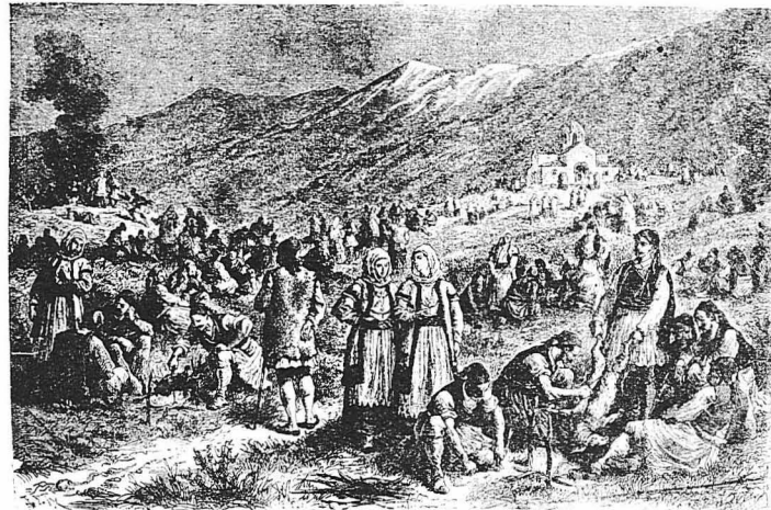
ΣΤΑ ΧΡΟΝΙΑ ΤΗΣ ΣΚΛΑΒΙΑΣ. — Το ψήσιμο των Πασχαλινών άρνιών. (Είκοσι έξενου Περιγηρώ)

Τά ρούχα τους ήταν όμοιοαίνωτογα, «από τη βελόνα», καθώς λέγανε, γιατί τό θεωρούσαν ντροπή κ' άμαρτία να φορέσουν τη Λαμπρή ρούχα ζαναφορένια.