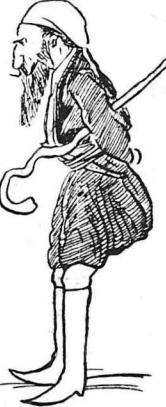
—Τι λένε στο Λονδί- νο για τους Λακκιούς ;

Άρχισανε, μάλιστα, νά μη τον χο- ρουν τά «πο- τούκιας» του και του φτια- σανε «σαλά- ριας» (βράκες Κρητικές).