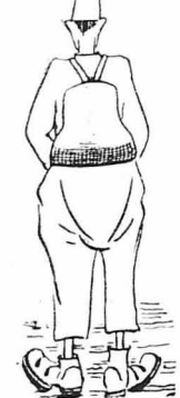
—Τι θα μās πε- ράσουν για τιπο- τε Χαλκιώτες :