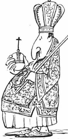
...Σίγουρα θα με περάσανε για τον Τάσο των Βουλγάρων.