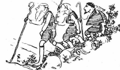
Τό χωριό πήγε σύσσωμο στά Χανιά.

Έτσι έγινε τετράραχος, σοστό θεεφτάρι, ό Μεδέλλκος.