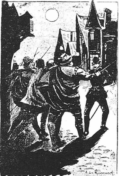
'Ο ύποκόμης νι' Άστερμιάν άρχισε να χεντιέται μαζί τους...

Ο ύποκόμης κατέλαβε τή θέσι τού άμάξι και ο Έρριος Μονω-