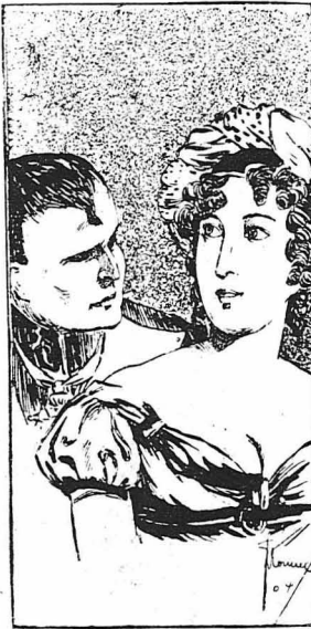
'Ο Μέγας Ναπολέων και η 'Ιωσφίνα.

'Εκείνοι που κάνουν εύεργεσιες στους ξένους είναι συνήθως άνωτόφοροι στην οικογένεια τους. -'Αν θέλεις να γίνης καλός, πρέπει να πιστέψης πρώτα πως είσαι καλός.