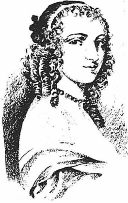
'Η Νινόν ντε Λαγκλό

('Από τη Συλλογή ερωτικών 'Επιστολών των Μεγάλων Προσωπών της 'Ιστορίας του Γάλλου 'Ακαδημαϊκού Πιέρ ντε Νολζ, η όπεκ εξέδθη τελευταία στο Παρίσι).