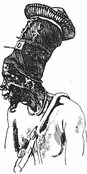
Ἰνδὸς Γόης "Ὀφρον

λοῦς Ἰνδοῦς, καὶ περιμένει μὲσὸν τοῦς γὰ νὰ ἰδῆ τὸ ἀποτέλεσμα.