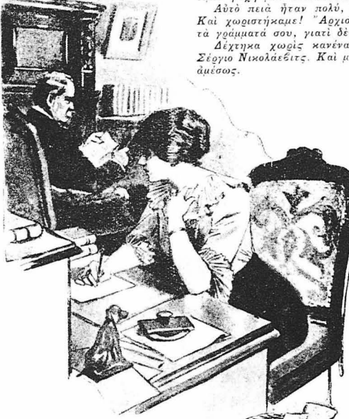
Τό πρωί της περασμένης ημέρας, ή Ειρήνη είχε καθήσει στό γραφείο κ' έγγραφε μιά επιστολή..

—Τί έχεις; τόν ρώτησε ή Ειρήνη κιντίζοντας τον μέ μιά άδυνή-