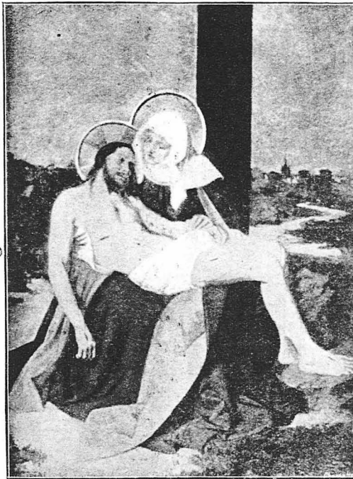
Ἔ, Γλυκὺ μου Ἔαρ!...