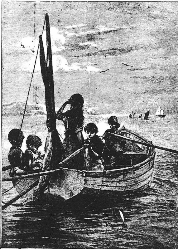
Μὲ τὴ Βάρκα (Τοῦ Ἀλφρέδου Δασίδ Καρρ)