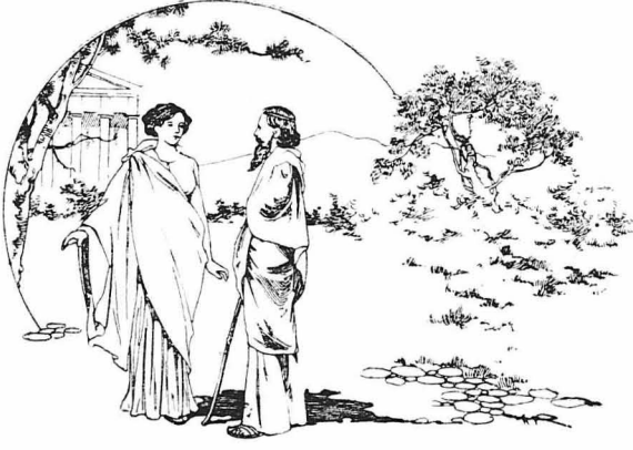
Τον πλησίασε ή όφρα άνεμιά του Χρυσής και του ελεπ...