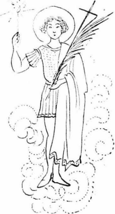
—Αὐτὸς εἶπε ὁ Ἄγγωι Ἀντωνῶνιος, τὸν καιρὸ ποῦ ἦταν νέος!

—Μὰ ὁ Ἄγγωι Ἀντωνῶνιος εἶπε γένεια καὶ τούτῳ εἶνε ἀμῶσταισται ποῦδ!... —Ἐοῦ, τοῦ ἀπῶντης ὁ γέρος, εἶπε γένεια ἀπὸ τότε ποῦ γενεῆρῆς; —Ὁχι! —Ἐ, καὶ ὁ Ἄγγωι Ἀντωνῶνιος τὸ λοιπὸν, ἔδῳ, εἶνε τότε ποῦ ἦταν νέος!... Κανεῖς δὲν εἶπε σὲ τούτῳ τίποτε νὰ πῆ, ποῖς ἤξερες στὰ νῆματα τοῦ τὸν Ἄντωνῶν καὶ κῆνος ποῦ ζῆησται τὸ εἰκόσιον τὸ πῆρῶσι καὶ τὸ πῆρῶσι... ***