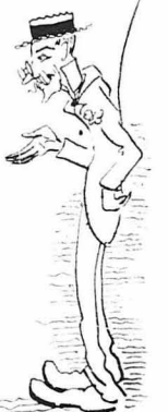
—Ἀνώτερος ὑπάλληλος τῆς Ἐπιτροπῆς Ἀποκαταστάσεως!

—Μὰ ὁ Ἄγγωι Ἀντωνῶνιος εἶπε γένεια καὶ τούτῳ εἶνε ἀμῶσταισται ποῦδ!... —Ἐοῦ, τοῦ ἀπῶντης ὁ γέρος, εἶπε γένεια ἀπὸ τότε ποῦ γενεῆρῆς; —Ὁχι! —Ἐ, καὶ ὁ Ἄγγωι Ἀντωνῶνιος τὸ λοιπὸν, ἔδῳ, εἶνε τότε ποῦ ἦταν νέος!... Κανεῖς δὲν εἶπε σὲ τούτῳ τίποτε νὰ πῆ, ποῖς ἤξερες στὰ νῆματα τοῦ τὸν Ἄντωνῶν καὶ κῆνος ποῦ ζῆησται τὸ εἰκόσιον τὸ πῆρῶσι καὶ τὸ πῆρῶσι... ***