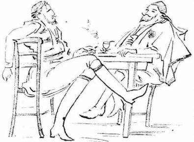
Στὰ καφενεῖα, σὸ πρῶσιλιον...