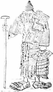
Ἐνας γέρος τσακισμένος καὶ ἀρχῶς...

«Ο Θεός έγινε από ψηλά ἄβυσσον τὴν λαοκράτην στὴν βωανουμένη, ἀπὸ τὸν πολέμηγο καὶ δομῆν ζωοῦνα, φῶς. Τὰ παρομένα μὲτ' ἑλὲν τῶν ζῶων, τῶν ποσειῶν, τῶν ἀνθρώπων μαλακῶν καὶ ξεπῶν γυνῶν. Ἡ γυναιξὲς εἶχαν βγεῖ στὶς ἀλλεῖς, οἱ ἄνθρωποι στὰ καφενεῖα, στὸ πρῶσιλιον. Τὰ σπουδῆτα παῖζαν προδῶχα, ἕνα αὐτοκίνητο πέρας λαοκοκῶντατος κατὰ ἀπὸ τὸν ἥλιο, σὰν τρῆστιο μηχανοποῦν, καὶ ἄρινοντα λίπυ τὸν σὸνῶν ἰσχυρῆ, τὰ καράκια πετοῦσαν στὸν οὐρανὸν καὶ κροῦζαν... Ἄγνα ἑσθητὴ σὰν ἄνασσα ἔβγαν ἀπὸ τῆ γῆ.