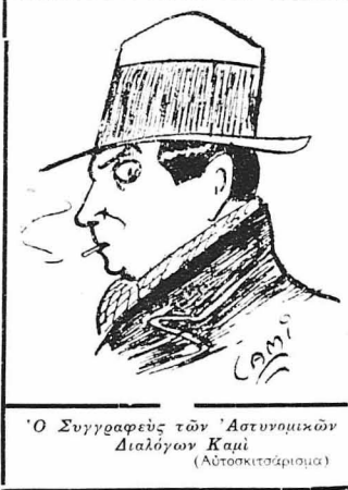
Ο Συγγραφέας τών Αστρινωμικών Διαλόγων Καμί (Αυτοσκιτγράμμα)