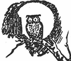
Από τον τρομερό κακούργο Φαντομά.

(Ο Καμί είναι ένας από τους περιομη- τέρους Γάλλους εθιμογράφους. Οι αστυνο- μικοί του διάλογοι, με τη χαριτωμένη πλο- κή τους και την απροσποίητη λύση τους, αποτε- λούν μία λεπτή σατυρά κατά των συγγρα- φικών αστυνομικών μυθιστορημάτων. Έτσι ο Λούφοκ-Χόλμς του διαλόγου που δημοσι- εύουμε δεν είναι άλλος από τον περίφημο ασ- τυνομικό Σέρλοκ-Χόλμς και ο Φάντομας