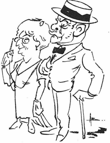
Ὁ κ. καὶ ἡ κ. Μερκούρη. Ἡ Θεοδώρα καὶ ἡ Ἀσπασία δὲν ὑπάρχουν στὸ σκίτσο γιατί... ἀτοκτόνησαν ἀπὸ τὸ κακό τους ! (Σκίτσος τοῦ κ. Βώττη)