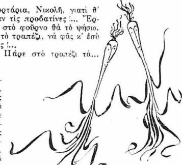
Και ήήσανε χορηπιδόντας τά φρέσκα και «λαγανές» ζεστές κρομινδάκια μέ τά μακρουλά τους πόδια... και σουσιμάτες άπ' τό φρέγγο και βροχτοκόκο κι' έληξες, και περιέρξες και ταρμισιαλάτα, φάβες και κρομινδάκια, και ρατανάκια.