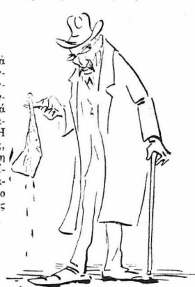
Κρατώντας μέ τό δάχτυλο τού καθμαγμένο μπουτι.

"Ετσι έπε και μέθος και πήδησε και χόρνε με τις καρδέλες / Κρατώντας μέ τό δάχτυλο τού καθμαγμένο μπουτι.