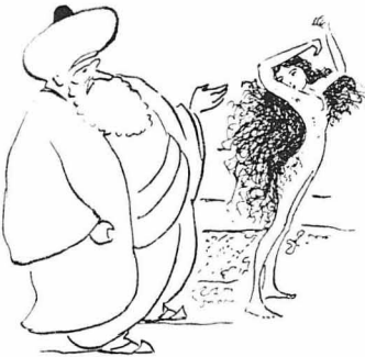
Κανένας πασις δέν χάριζε έτσι τήν άγαπημένη του τή σκλάβο.

"Όλη ή εύτυχία τής ζωής του κι' όλη του ή χαρά ξεχνόντανε μέ