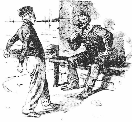
—Τόν είδα μέ τά ίδια μου τά μάτια, είπε ο θαλασσόλυκος.

Ο Σουλτάνος της Τουρκίας είχε τούς έξής τίτλους : Άρχηγός τών Πιστών, Σουλτάνος τών Σουλτάνων, Βασιλείς τών Βασιλείων, Διανομέας τών... στεμμάτων. Σαύ τό Θεοί έπί της γής, Αιτοκράτορ και Κύριος και Αδώντης της Μαύρης και της Λευκής Θαλάσσης, της Αιγύπτου, της Μέκας και της Ίερουσαλήμ.